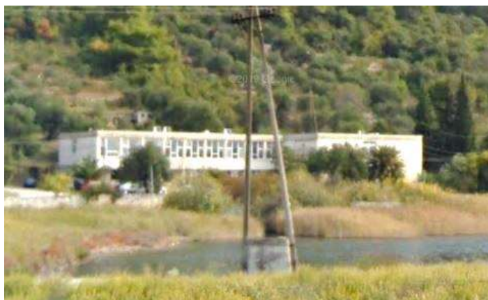
2. zgrada MŠ Ston