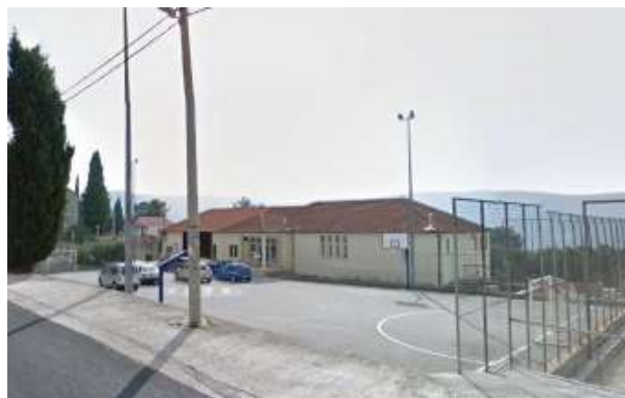
3 Zgrada PŠ Ponikve