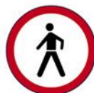
ZABRANA PROMETA ZA PJEŠAKE