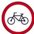
ZABRANA PROMETA ZA BICIKLE